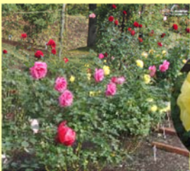
● バラ (北バラ園・東バラ園)