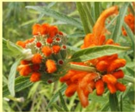
○ レオノチス (霧の庭園)