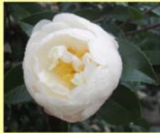
○ サザンカ (北館前)