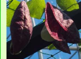
アリストロキア・ギガンティア (スロープ上)