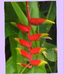
ヘリコニア (ガジュマルの下)