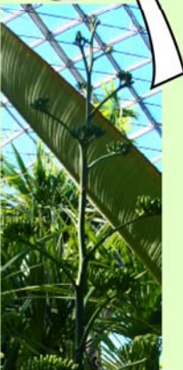
リュウゼツラン (滝の横)