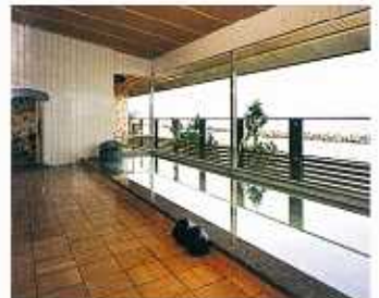
展望浴場「美保の湯」

湯上がりにほっとくつろぐ落ち着いたスペース。 最新の電動マッサージチェアも設置しております。 リゾートらしい雰囲気がきつとお気に召すでしょう。