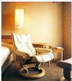
ノルウェー製の「ストレス・レス」チェアで、海を眺めながらゆっくりとおくつろぎください。