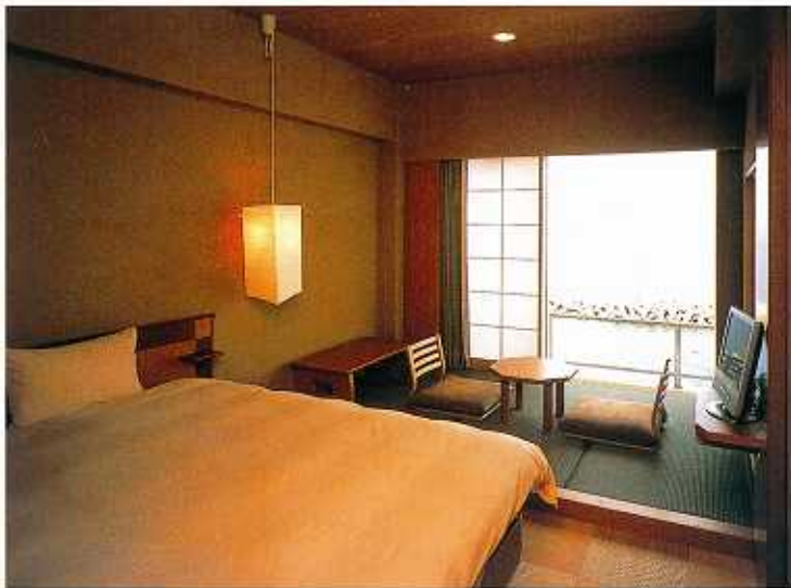
リラックスダブルルーム