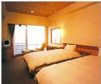
世界No.1を誇るシモンズ社の高級ワイドベッド。 その寝心地は、まさに「雲の上」の感触です。