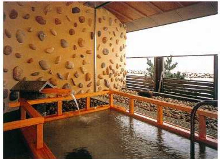
ひのき風呂「汐風の湯」